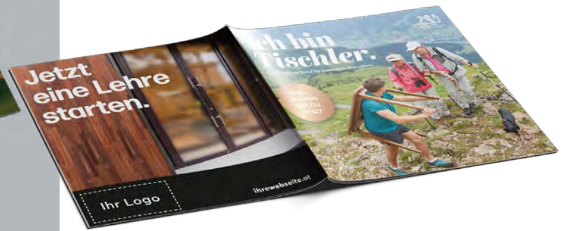
Lehrlingsfolder mit Firmenbild auf der Rückseite