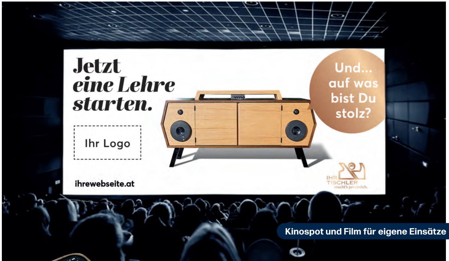
Kinospot und Film für eigene Einsätze