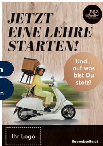
Inserate in unterschiedlichen Formaten