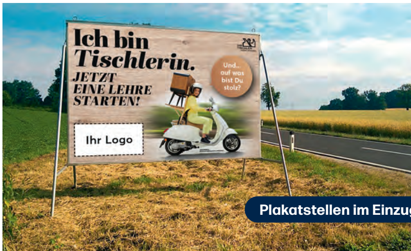
Plakatstellen im Einzugsgebiet