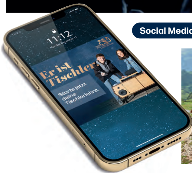
Social Media Frames, Posts und Banner